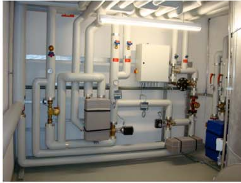
Vaduz LAK Altersheim: Gössi-Mat mit Wärmerückkoppelung, thermischer Desinfektion und Ionisierung