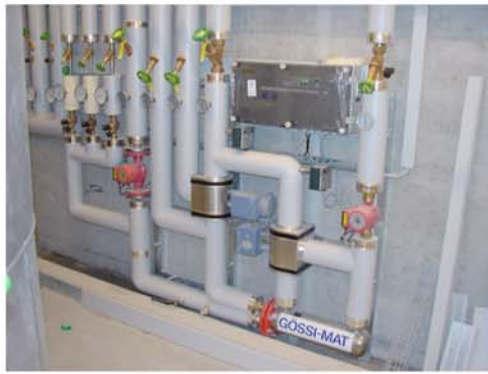
Gössi-Mat Mischwasseranlage mit thermischer Desinfektion