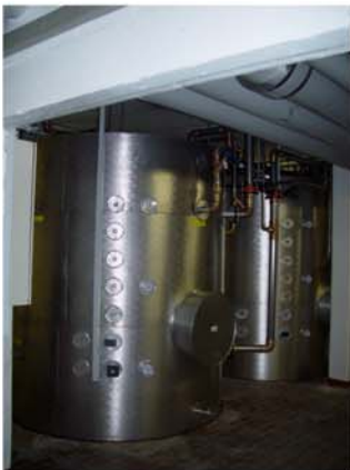
Hallenbad Oerlikon: Legionellensichere Warmwasser Zentrale