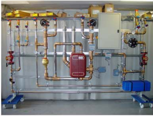
Hallenbad Oerlikon: Gössi-Mat mit Wärmerückkoppelung direkter und indirekter thermischer Desinfektion und zusätzlicher Ionisierung