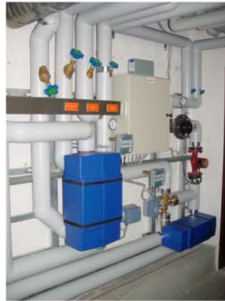
Altersheim Rorschach Ausschnitt von der Wärmerückkoppelung und der Ionisierung