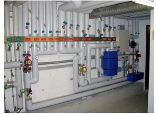
Altersheim Rorschach Mischwasseranlage nach der Sanierung mit Wärmerückkoppelung, thermischer Desinfektion und Ionisierung