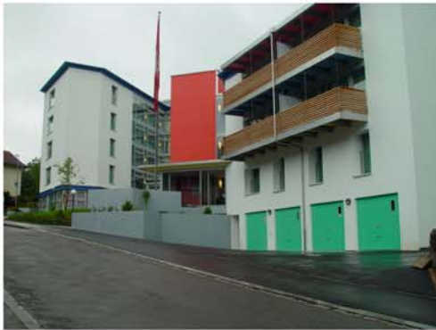
Ansicht Altersheim Kloten