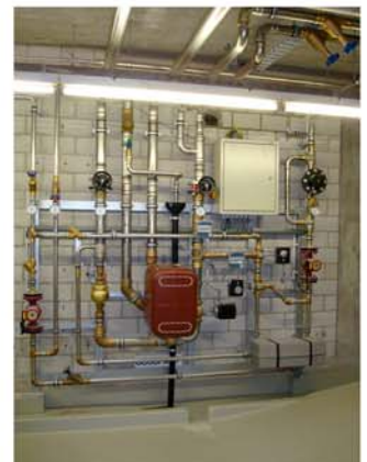
Herzogenbuchsee Hallenbad: Gössi-Mat mit Wärmerückkoppelung indirekter und direkter thermischer Desinfektion und Ionisierung