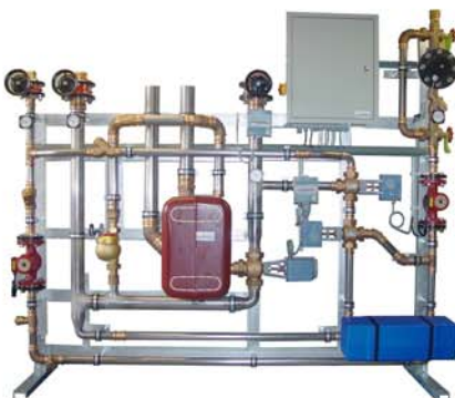
Hallenbad Oerlikon GÖSSI-Mat mit Wärmerückkoppelung indirekter und direkter thermischer Desinfektion sowie einer Ionisierung