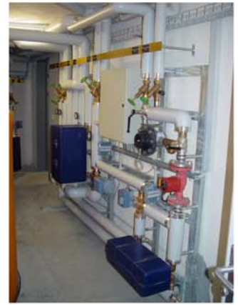
Altersheim Kloten Gössi-Mat Mischwasseranlage mit Wärmerückkoppelung, thermischer Desinfektion und Ionisierung