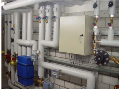
Altersheim Flawil Mischwasseranlage mit Wärmerückkoppelung, thermischer Desinfektion und Ionisierung