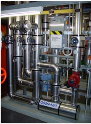
Luzern Hotel Flora: neue Mischwasseranlage GÖSSI-Mat im thermischer Desinfektion