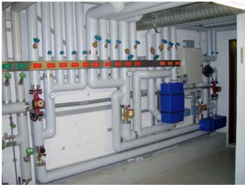
Altersheim Rorschach Gössi-Mat mit Wärmerückkoppelung, thermischer Desinfektion und Ionisierung