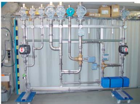
Gössi-Mat Mischwasseranlage mit thermischer Desinfektion