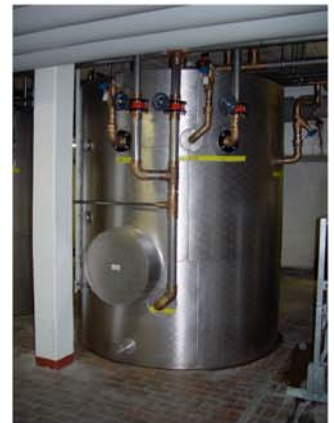
Hallenbad Oerlikon Ansicht der Warmwassere-Zentrale