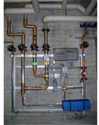
Ersatz Mischwasseranlage mit thermischer Desinfektion