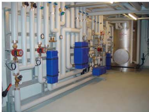
Altersheim Rüti Gössi-Mat Mischwasseranlage mit Wärmerückkoppelung, thermischer Desinfektion und Ionisierung