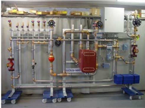
Meilen Schulanlage: Gössi-Mat mit Wärmerückkoppelung indirekter und direkter thermischer Desinfektion und Ionisierung