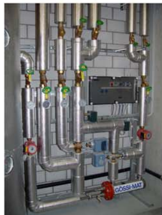
Gössi-Mat Mischwasseranlage mit thermischer Desinfektion