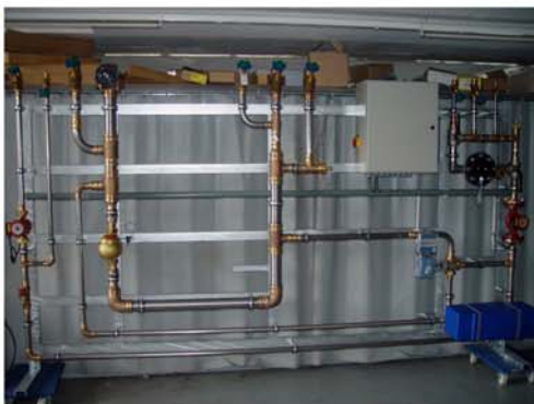
Luzern Altersheim Sunnmatt Warmwasser Station mit integrierter Ionisierung