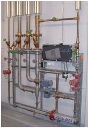
Gössi-Mat Mischwasseranlage mit thermischer Desinfektion