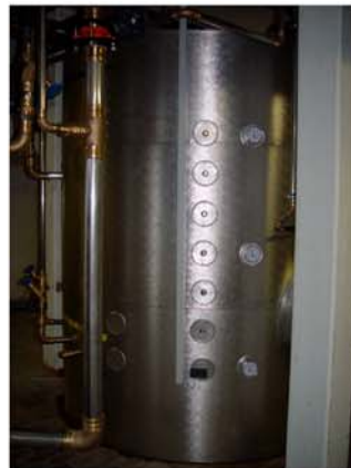
Hallenbad Oerlikon: Ansicht der Warmwassere-Zentrale