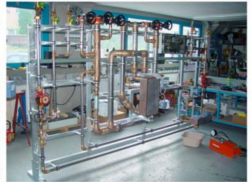
Gössi-Mat Anlage mit Wärmerückkoppelung, thermischer Desinfektion und Ionisierung in der Fertigung