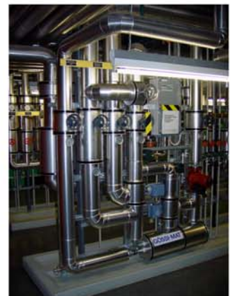
Luzern Hotel Flora. Die alte Anlage wurde durch eine neue Anlage ersetzt