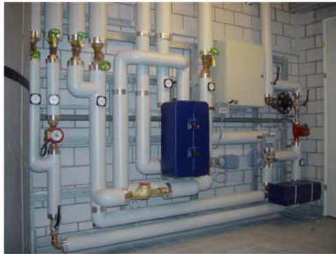
Altersheim Unterberg. Gössi-Mat mit Wärmerückkoppelung, thermischer Desinfektion und Ionisierung