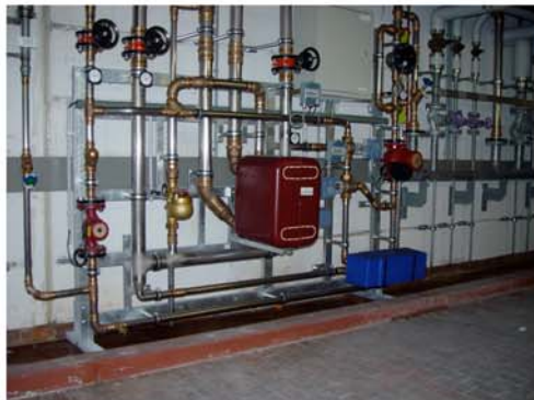
Hallenbad Oerlikon nach der Sanierung