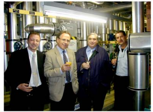
Hotel Flora Luzern: feierliche Einweihung der neuen GÖSSI-Mat Anlage