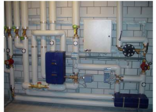
Unterberg Altersheim: Gössi-Mat mit Wärmerückkoppelung, thermischer Desinfektion und Ionisierung