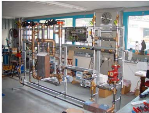
Anlage Hallenbad Oerlikon in der Fertigung