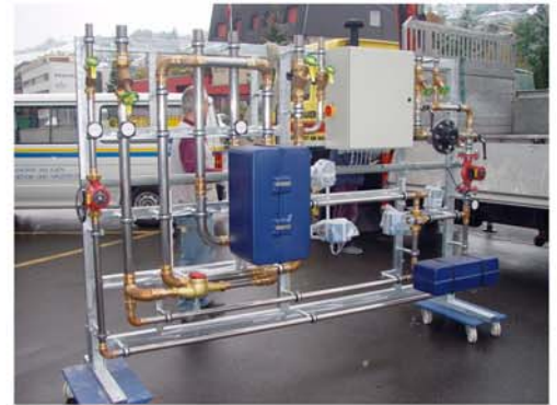
Gössi-Mat Mischwasseranlage vor der Verladung